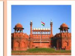
♥♥♥ Agra Fort