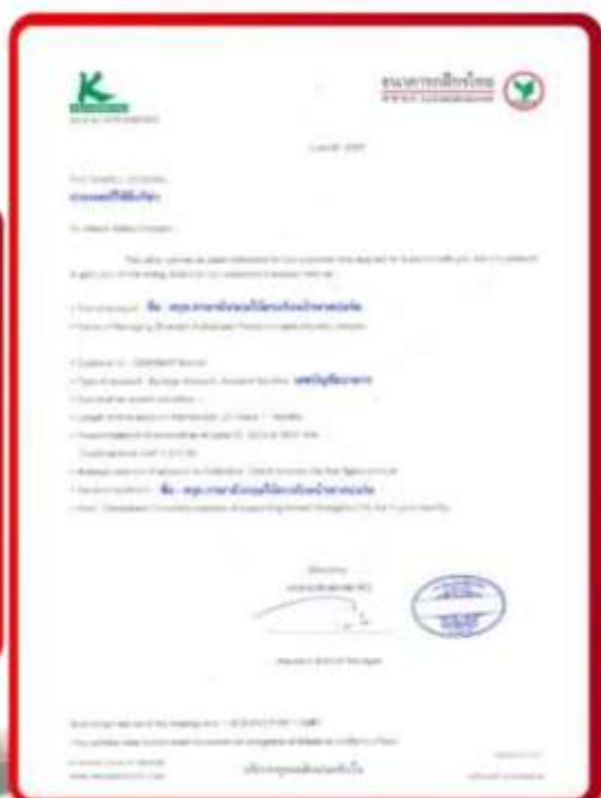
ตัวอย่าง Bank Guarantee ที่ยื่นได้ตรงกับกัมพูชา