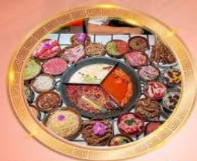
บุฟเฟต์หม้อไฟลงชิ่ง