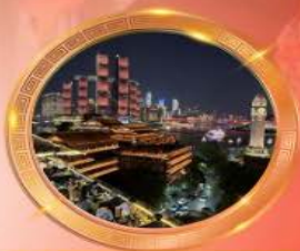
มือค้ำร้านอาหารอวโหล่งล้า