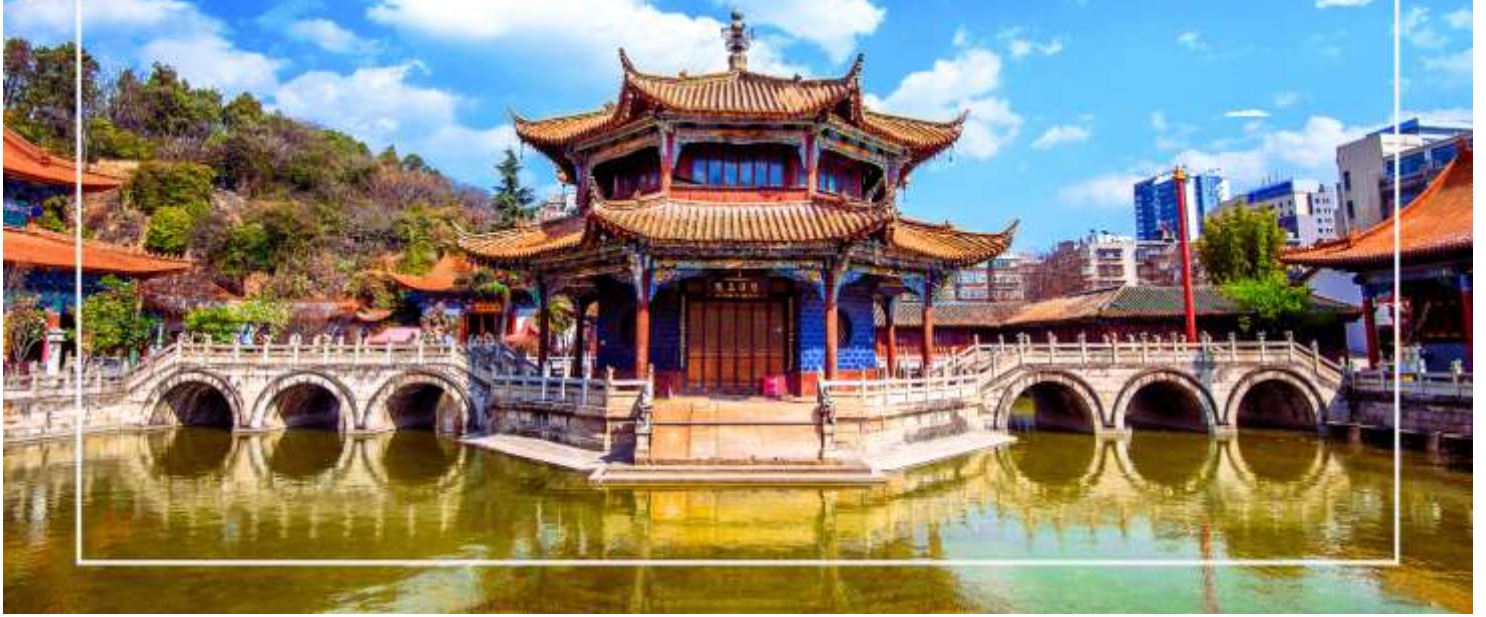
วัดหยวนตง (Yuantong Temple)