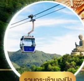
รวมกระเช้าฮ่องกง