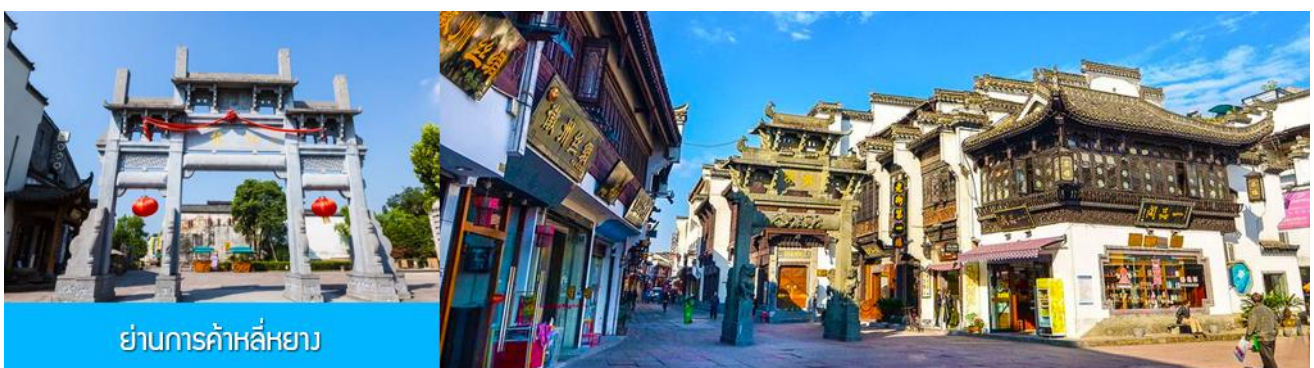
ย่านการค้าลี่หยาง

เที่ยง อิสระอาหารมื้อกลางวัน ( ท่านสามารถเลือกชิมอาหารพื้นเมืองในระแวกโรงแรมได้ตามอัธยาศัย )