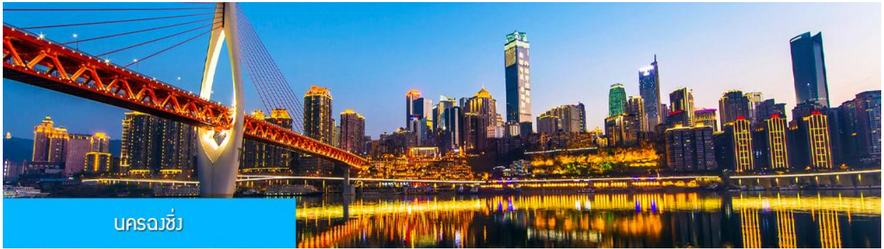
นครฉงชิ่ง