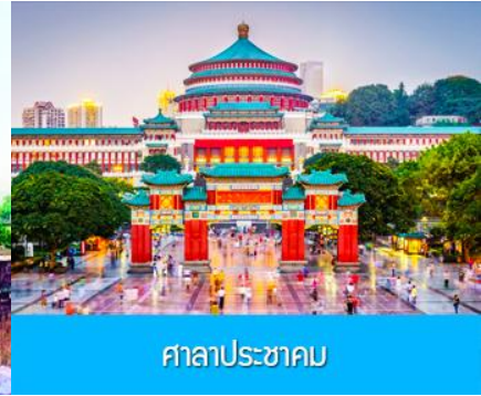
ศาลาประชาชน

วันที่สี่ อิสระ ฟรี 1 วัน (ไม่มีอาหารและรถบริการ)