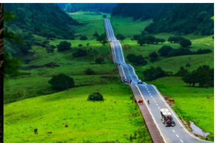
อุทยานเขาเบงฟ้า