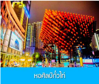
หอศิลป์กั๋วไท่

นำท่านเก็บภาพที่แสนมหัศจรรย์ ณ สถานีรถไฟลอยฟ้า หลี่จื่อป้า 穿楼轻轨 ชมและเก็บภาพความมหัศจรรย์ของ ขบวนรถไฟที่วิ่งทะลุตัวตึก และจอดเทียบสถานีที่ตั้งอยู่บริเวณชั้นที่ 6-8 ของอาคาร และขบวนรถไฟจะไปทะลุออกอีกด้านหนึ่งของตัวอาคาร พร้อมก็นำท่านนั่งรถไฟทะเลตุ๊ก