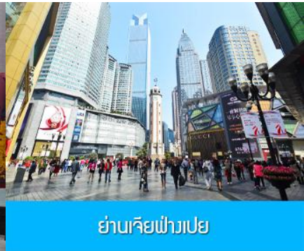
ย่านเจียฟางเปย