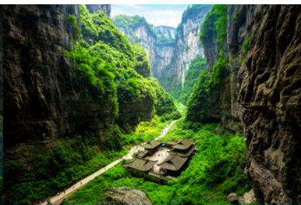
สะพานธรรมชาติสามแห่ง