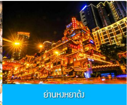
ย่านหงหยาดง