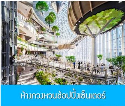
ห้างกวงหวนช้อปปิ้งเซ็นเตอร์