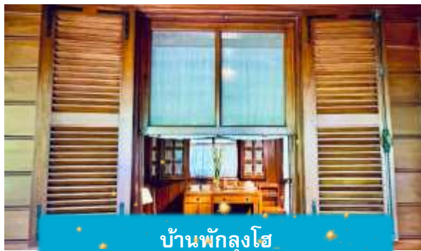
บ้านพักลุงโฮ