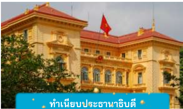
ทำเนียบประธานาธิบดี

เช้า บริการอาหารเช้า ณ ห้องอาหารของโรงแรม นำท่านถ่ายรูปด้านนอก สุสานโฮจิมินห์ จุดเริ่มต้นของการเข้าใจเวียดนาม สถานที่อันเงียบสงบที่สะท้อนจิตวิญญาณของผู้นำผู้ยิ่งใหญ่ สุสานแห่งนี้ไม่ได้เป็นเพียงอนุสรณ์ แต่คือบทเรียนประวัติศาสตร์ที่สัมผัสได้จริง นำท่านเดินทางสู่จุดศูนย์กลางแห่งประวัติศาสตร์เวียดนาม นำชมด้านนอก ทำเนียบประธานาธิบดี อาคารสีเหลืองอร่ามในสไตล์ฝรั่งเศส ที่ยังคงใช้ในพิธีการสำคัญของชาติและชม บ้านพักลุงโฮ บ้านไม้เรียบง่ายริมสระบัว ที่เผยให้เห็นชีวิตสมณะของผู้นำผู้ยิ่งใหญ่ "โฮจิมินห์" สองสถานที่ สองเรื่องราวที่สะท้อนความเป็นเวียดนามอย่างลึกซึ้ง ไม่ใช่แค่ท่องเที่ยว แต่คือการเข้าใจจิตวิญญาณของประเทศนี้อย่างแท้จริง เที่ยง บริการอาหารกลางวัน ณ ภัตตาคาร