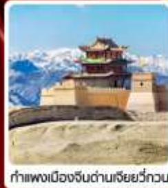
กำแพงเมืองจีนด่านเสี่ยววีกวน

• ไฮไลต์...เส้นทางสายไหม ชมสระบัววังพระจันทร์ ทะเลทรายหมิงซาซาน กำแพงเมืองจีนด่านสุดท้าย "เจียยวีกวน" มรดกโลกภูเขาสายรุ้งจางเย่