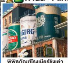
พิพิธภัณฑ์เบียร์ชิงเต่า