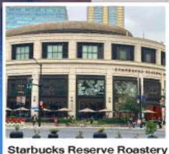
Starbucks Reserve Roastery