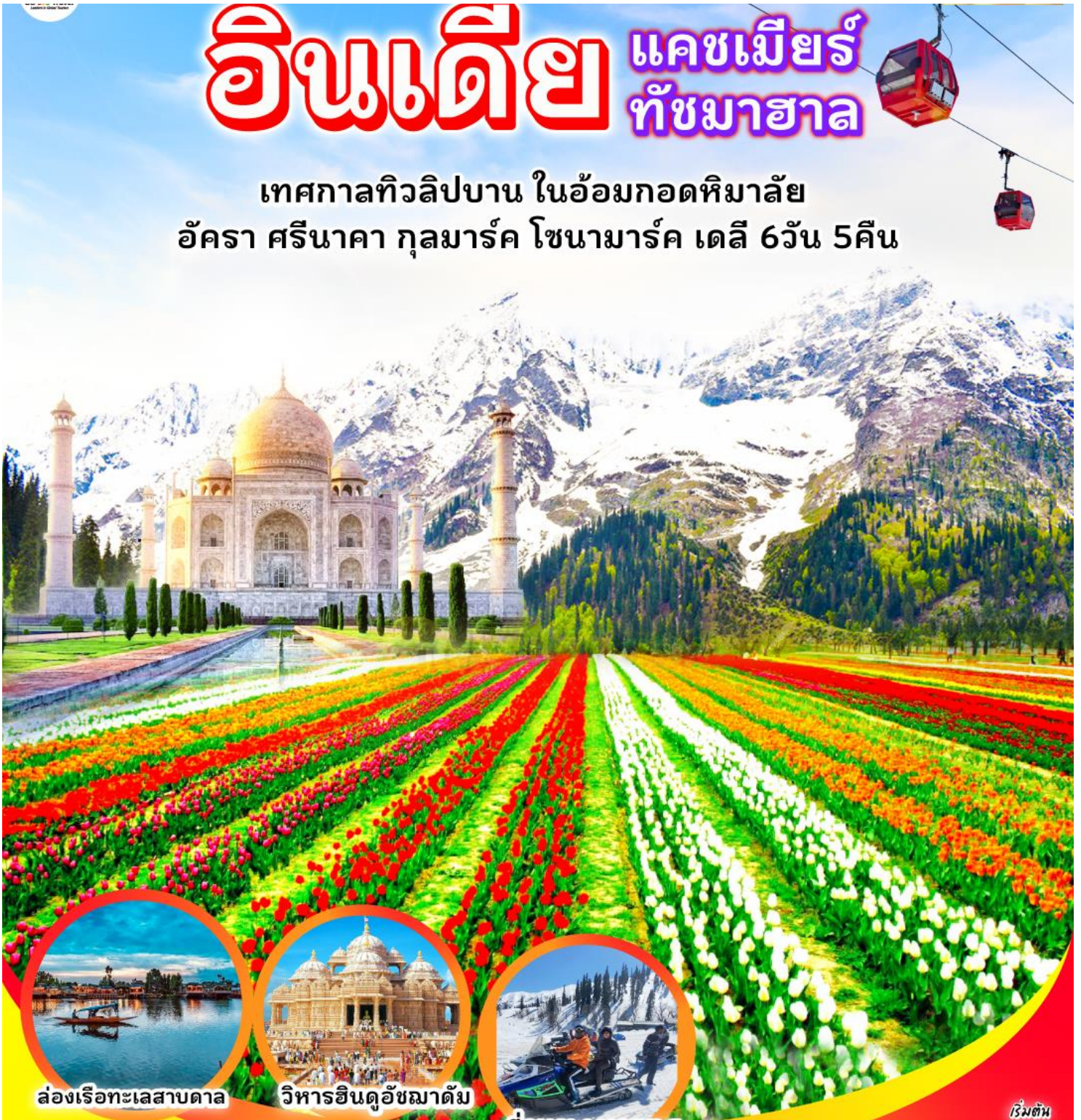
ล่องเรือทะเลสาบตาเล

เทศกาลทิวลิปบาน ในอ้อมกอดหิมาลัย อัครา ศรีนาถา กุลมาร์ค โซนามาร์ค เดลี 6วัน 5คืน