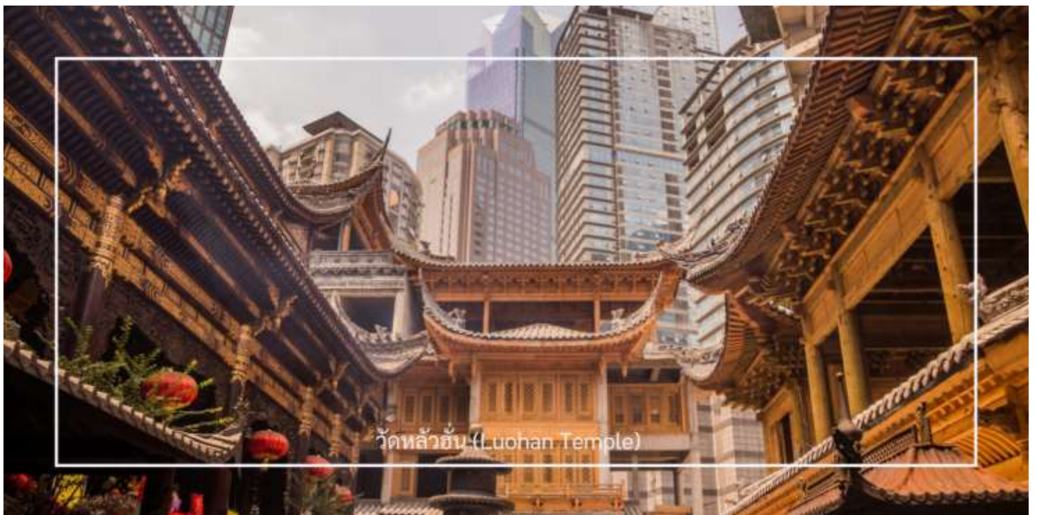
วัดหลัวฮั่น (Luohan Temple)

นำท่านเที่ยวชม วัดหลัวฮั่น (Luohan Temple) หรือที่เรียกว่า "วัดอรหันต์" เป็นวัดที่มีชื่อเสียงในเมืองฉงชิ่ง มีประวัติศาสตร์ยาวนานและมีความสำคัญในด้านศาสนาพุทธ วัดหลัวฮั่นมีพระพุทธรูปและรูปปั้นอรหันต์จำนวนมาก ซึ่งเป็นที่เคารพนับถือของผู้มาเยือน นอกจากนี้ยังมีบริเวณที่ให้ผู้เข้าชมสามารถทำบุญและสวดมนต์