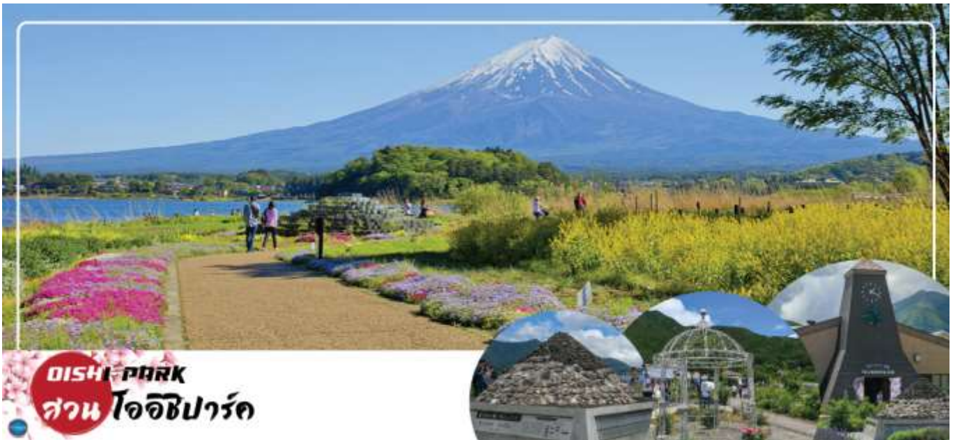
OISHI PARK สวน โออิชิพาร์ค

วันที่สาม จังหวัดยามานาชิ – สวนสาธารณะโออิชิ – พิพิธภัณฑ์ญี่ปุ่น – โกเทมบะพรีเมียมเอาท์เล็ต – เมืองนาริตะ – อีออน มอลล์ นาริตะ