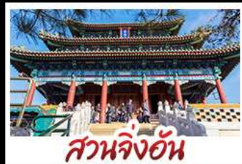
สวนจิ่งอัน