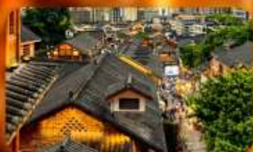
เมืองโบราณสี่ปาตี