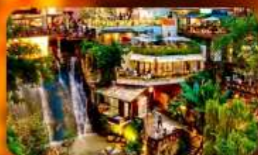
ถนนโบราณหลงเหมินฮ่าว