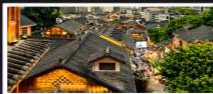
เมืองโบราณสี่牌坊