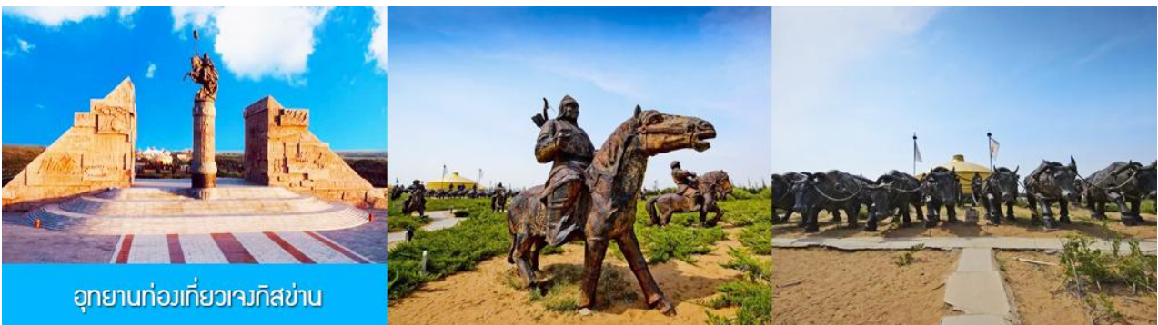
อุทยานท่องเที่ยวเจงกิสข่าน

รับประทานอาหารกลางวัน ณ ร้านอาหารพื้นเมืองในเขตอุทยาน (11)