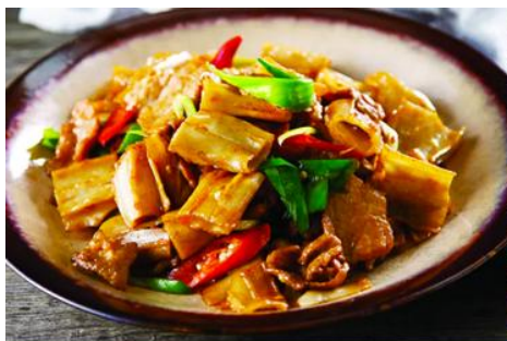
ถนนคนเดินเออร์ดอส

จากนั้นนำท่านเที่ยวชม อุทยานคังปาสือ 康巴什景区 เป็นเขตเมืองใหม่ที่ถูกเนรมิตรขึ้นและได้รับการขึ้นทะเบียนเป็นอุทยานท่องเที่ยวระดับ 4A และเป็นศูนย์กลางความเจริญของเมืองเออร์ดอส ประกอบด้วยจัตุรัส ซิมปาร์ค พิพิธภัณฑ์ แกรนด์เธียร์เตอร์ ศูนย์วัฒนธรรม และสนามแข่งรถนานาชาติ นำท่านนั่งรถผ่านชมจัตุรัสรัฐบาล ทะเลสาบอุหลันมู่ สวนศิลปะงานปาดิมากรรมเอเชีย ฯลฯ