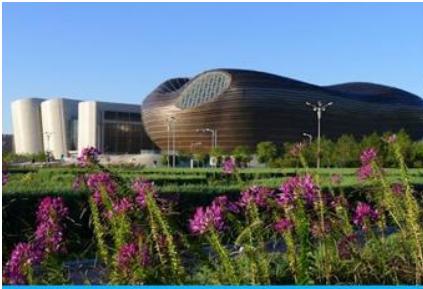
อุทยานคังปาสือ