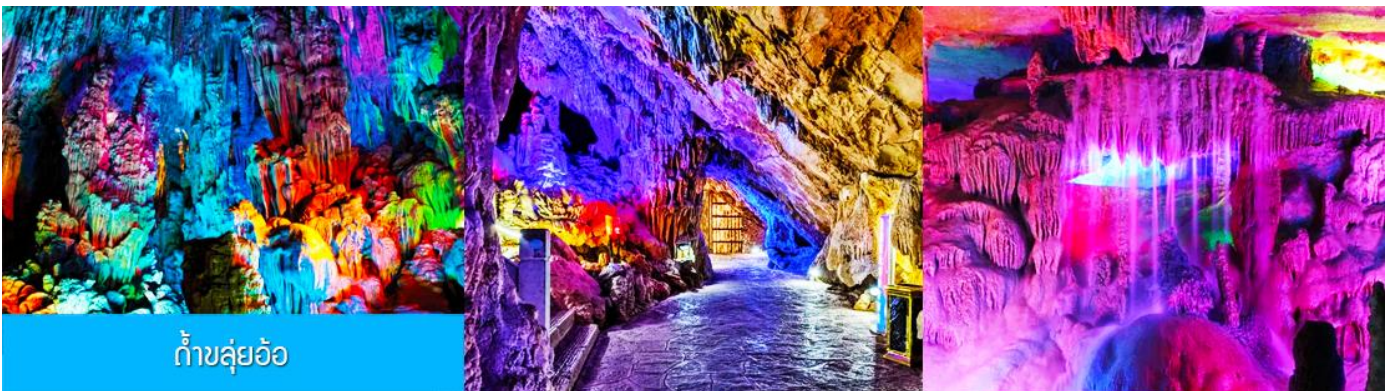
ถ้ำขลุ่ยอ้อ

พักที่ VIENNA INTER HOTEL ระดับ 4 ดาวท้องถิ่นหรือเทียบเท่าในเมืองกุ้ยหลิน