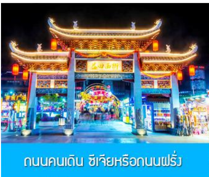
ถนนคนเดิน ซิเจียหรือถนนฝรั่ง