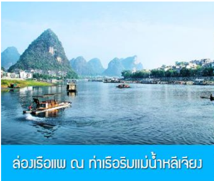
ล่องเรือแพ ณ ท่าเรือริมแม่น้ำหลีเจียง