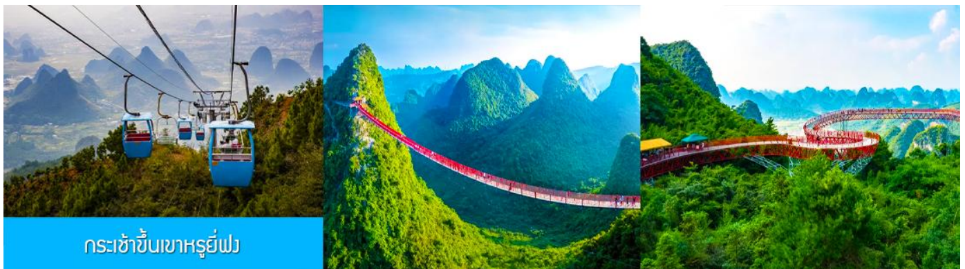
กระเช้าขึ้นเขาหฺรูยี่ฟง

อัตราค่าบริการสำหรับโปรแกรมเสริมการแสดงชุด The Impression of Liu san jie ท่านละ 350 หยวน ระยะเวลาที่ใช้ในการเที่ยวชมการแสดง ประมาณ 2 ชั่วโมงครึ่ง รวมเวลาเดินทางไป กลับ ค่าบริการรวม ค่าบัตรเข้าชม ค่ารถรับ ส่ง และค่าน้ำดื่มของไกด์ท้องถิ่น พักที่ YANGSHUO ELITE HOTEL ระดับ 4 ดาวท้องถิ่นหรือเทียบเท่าใน เมืองหยางชัว