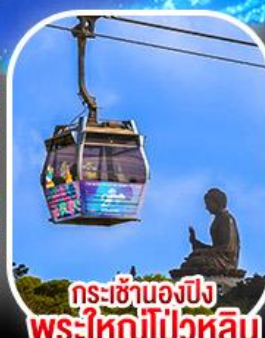
กระเช้าเองปีง พระใหญ่โป่วหลิน