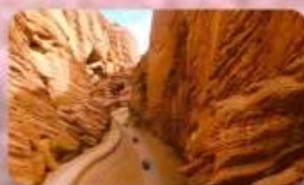
แกรนด์แคนยอนอาวูซือ