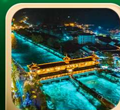
“สะพานหนานเฉียว น้ำคาสีฟ้า”