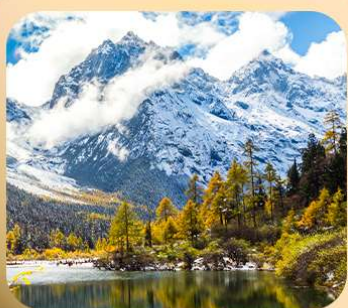
“ปี่ผิงโกว”

ชมธรรมชาติ 2 อุทยานขึ้นชื่อ อุทยานภูเขาสีดรุณี + อุทยานปี่ผิงโกว สะพานหนานเฉียว • ถนนคนเดินไท่กู่หลี่ + ซุนซีลู่ + Pop Mart • ตงเจียวจื่อ