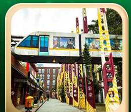
“ตงเจียวจื่อ”