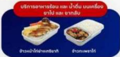
บริการอาหารร้อน และ น้ำดื่ม บนเครื่อง ยาไป และ ขากลับ