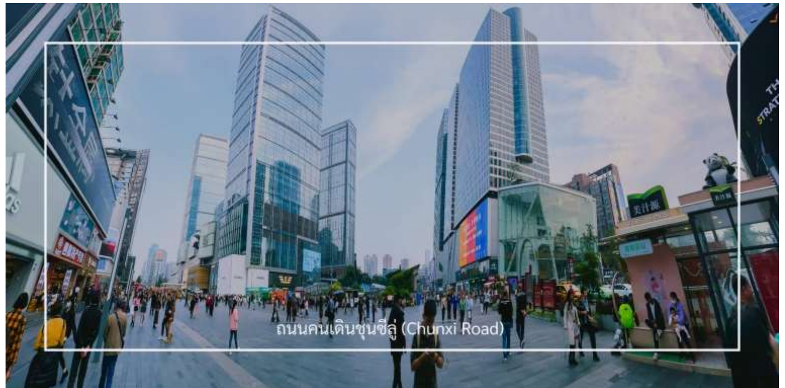
ถนนคนเดินชุนซีอู่ (Chunxi Road)

เดินข้ามถนนมาอีกหน่อย ท่านจะได้ซื้อป๊อง ถนนคนเดินชุนซีอู่ (Chunxi Road) เต็มไปด้วยร้านค้าแบรนด์ชั้นนำทั้งในและต่างประเทศ รวมถึงร้านเสื้อผ้าแฟชั่น รองเท้า อุปกรณ์อิเล็กทรอนิกส์ และของฝาก ถนนคนเดินชุนซีอู่เป็นจุดที่มีความคึกคักและเต็มไปด้วยผู้คน โดยเฉพาะในช่วงวันหยุดสุดสัปดาห์และเทศกาลต่างๆ คุณจะได้พบกับการแสดงศิลปะการแสดงดนตรี และกิจกรรมที่น่าสนใจ มีร้านอาหารมากมายที่เสิร์ฟอาหารท้องถิ่นและขนมหวานที่หลากหลาย นักท่องเที่ยวสามารถลิ้มลองเมนูพื้นเมืองที่อร่อย เช่น เสี่ยวหลงเปา (ซาลาเปานึ่ง) หรือขนมโบราณตามรอยซีรีส์จีนอย่าง มาโลโกว ก็มีเช่นกัน