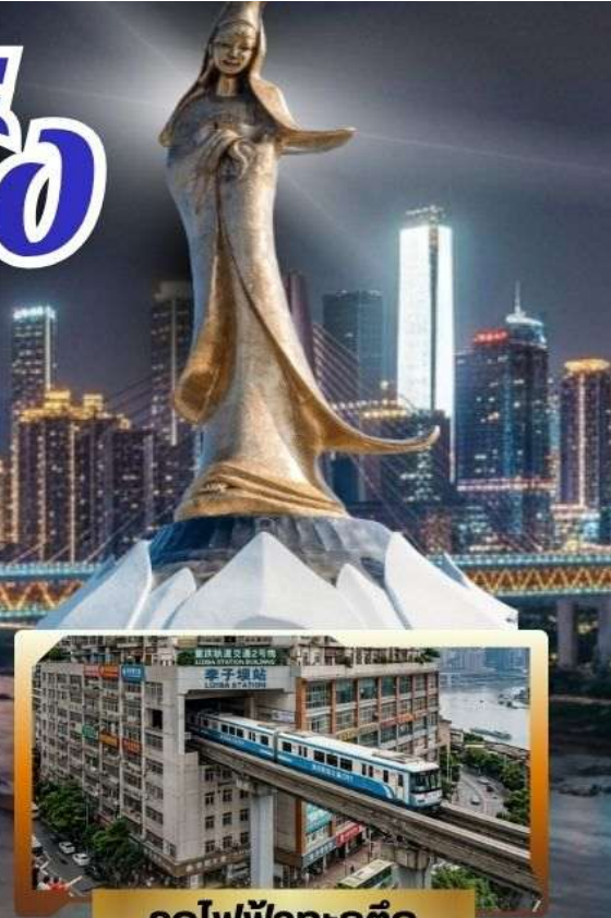
รถไฟฟ้าทะลุтик