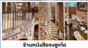
ร้านหนังสือจงซูเก้อ