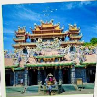
วัดกวนตู่