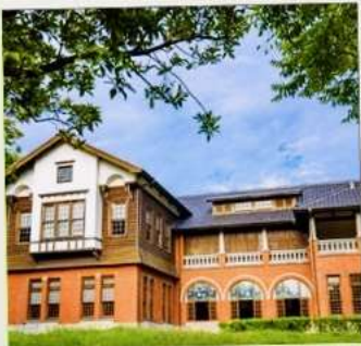
พิพิธภัณฑ์น้ำพุร้อนเป่ย์โถว