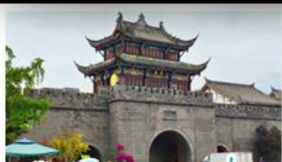
เมืองโบราณกวนเซี่ยน

ภูเขาสดรุณี - อุทยานป่ฝิงโกว - สะพานหนานเฉียว - ร้านหนังสือจงซูเก้อ - เมืองโบราณกวนเสียน จตุรัสหยางเทียนหวู่ - หิมะแพนด้าเซลฟี - ถนนโบราณชอยกว้างชอยแพบ - ถนนคนเดินไท่กู่หลี่ ถนนคนเดินซุนซี - ถนนโบราณจิ่นหลี่ - แพนด้ายักษ์ปิงตึก - น้ำพุไม้ไผ่ตึกSKP - วัดต้าเจี๋ย