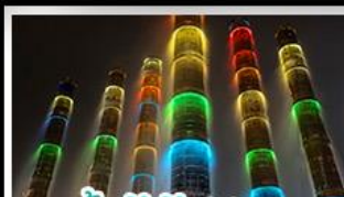
น้ำพุไม้ไผ่ตึกSKP