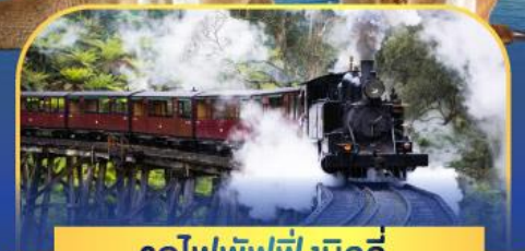
รถไฟพัพฟิงบิลลี่

ล่องเรือชมอ่าวซิดนีย์พร้อมรับประทานอาหารกลางวัน และ เข้าชมสวนสัตว์การองก้า