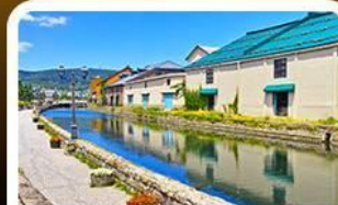
คลองไอตารุ