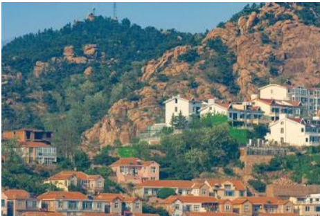
หมู่บ้านซาโจ้ว

จากนั้นนำท่าน เดินทางสู่ คาเฟ่อีสต 落日古堡 นำท่านชมปราสาทในเทพนิยาย ที่ตั้งตระหง่านอยู่ริมชายหาด นานาชาติไว้ให้ คาเฟ่ที่ออกแบบด้วยสถาปัตยกรรมสไตล์ยุโรป ตัดกับวิวทะเลสีคราม และที่นี่คือแม่เหล็กดึงดูดนักท่องเที่ยวมาเก็บบรรยากาศความสวยงามความโรแมนติก ( ตัวปราสาทเป็นร้านคาเฟ่ หากท่านต้องการเข้าไปด้านใน ต้องจ่ายค่าเครื่องดื่ม ตามเมนูของทางร้าน ซึ่งไม่รวมในอัตราค่าทัวร์ )