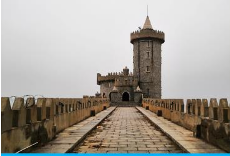
คาเฟ่อีสต