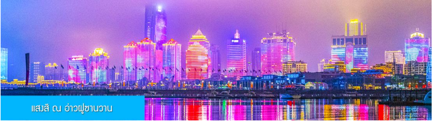
แสงสี ณ อ่าวฟูซานวาน

หลังอาหารนำท่านชมความอลังการของแสงสี ณ อ่าวฟูซานวาน 浮山湾灯光秀 ชมความอลังการของแสงสียามหัวค่ำ และไฟที่เต้นระบำได้บนตึกสูง และเป็นหนึ่งในไนท์วิวที่สวยงามที่สุดแห่งหนึ่งของจีน..... พักที่ JIFENG HOTEL / KAILAIZHIHUI HOTEL โรงแรมระดับ 4 ดาวท้องถิ่น เมืองชิงเต่า