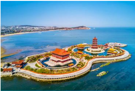
อุทยานท่องเที่ยวแปดเซียนข้ามทะเล