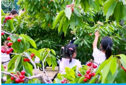
สวนเชอร์รี่