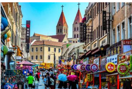
ถนนางซาน