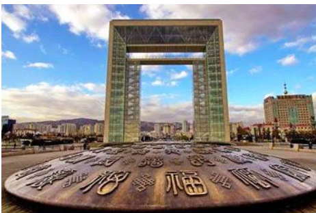
ประตูแห่งโชคกลาง