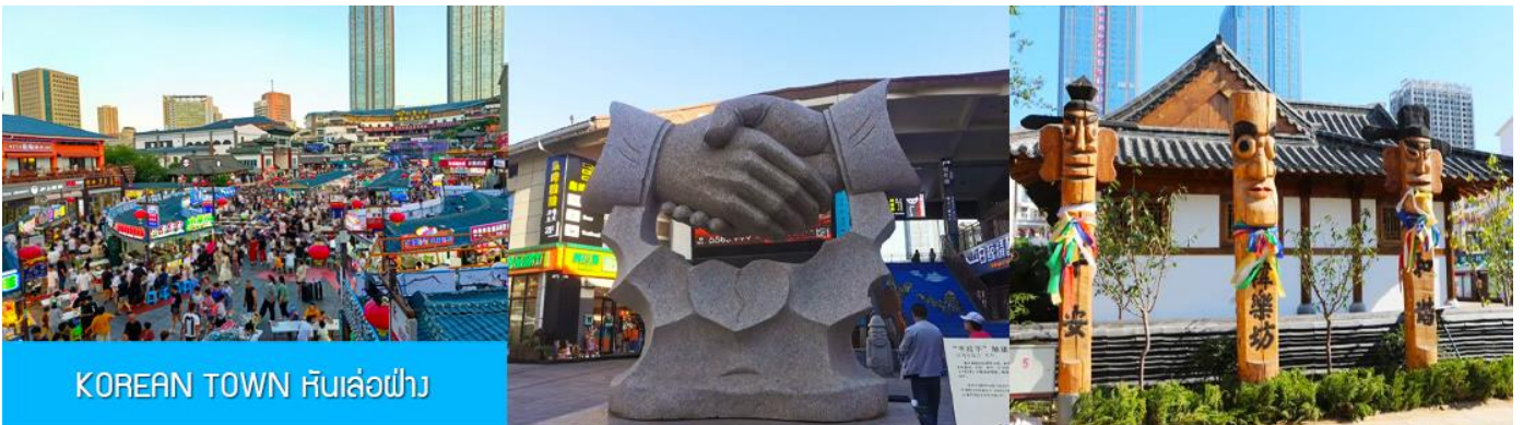
KOREAN TOWN หันเล่อฝาง