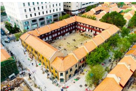
เมืองเก่าเยอรมัน ตรอกกว่างซิงหลี่