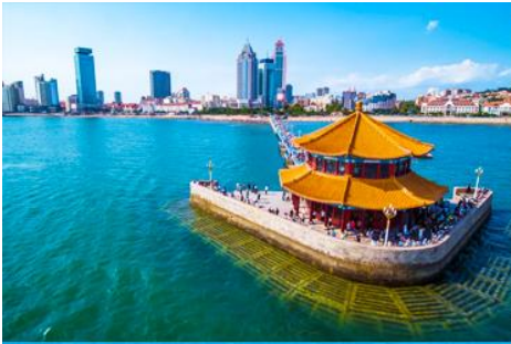
สะพานจ้านเจียว