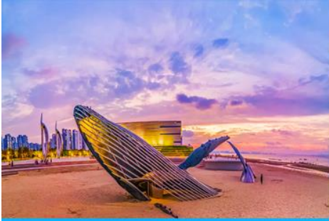
ประติมากรรม วาฬโด้เดี่ยว