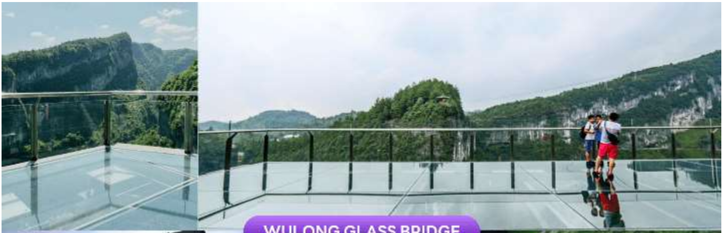
WULONG GLASS BRIDGE