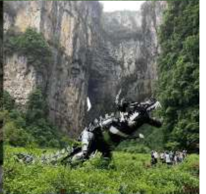
THREE NATURAL BRIDGE