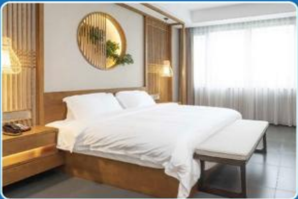
2 PERSON DOUBLE (DBL)