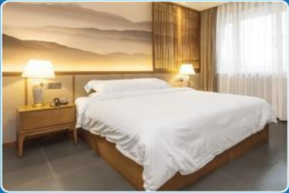
1 PERSON SINGLE (SGL)