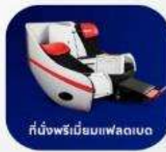
ที่นั่งพรีเมียมแฟลตเบด

บริการอาหารร้อน และ น้ำดื่ม บนเครื่องบิน ขาไป และ ขากลับ