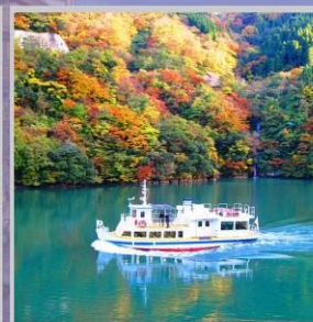
"SHOGAWA YURAN CRUISE"