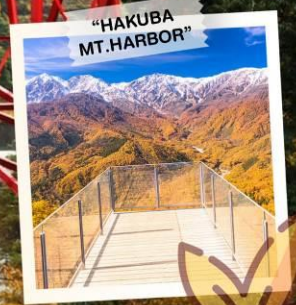
"HAKUBA MT. HARBOR"

วันเดินทาง 28 ต.ค. - 3 พ.ย. 2569 4 - 10 , 11 - 17 พ.ย. 2569