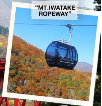
"MT. IWATAKE ROPEWAY"