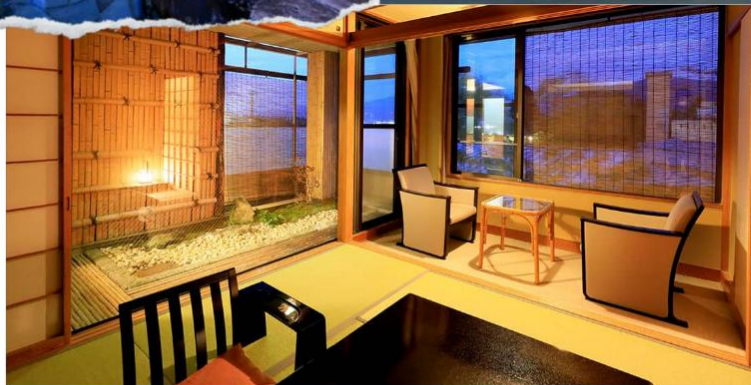
Japanese-style Room 17 sqm