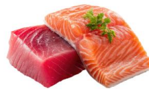
● ไส้ทานปลาดิบ