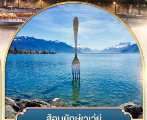
ล้อมยึกเขาวัว