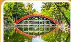
ศาลเจ้าสุมิโยชิ โทคะ