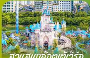
สวนสนุกโลกอเตเวอ์ล Lotte 'adventure world