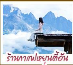
ร้านอาหารเขย่าต้นอัน

ชมวิวภูเขาหิมะสวยสุดโรแมนติกกับแสงยามพลบค่ำ เที่ยวเมืองโบราณต้าหลี่ ลี้เจียง ป่าชา แซงกรี่ล่า ชมวิถีชีวิตของชนชนยูนนานและทิเบต พิสูจน์ความกล้าท้าเดินชมสะพานแก้วลี้เจียง • ซุปโป่งเพลินที่ถนนคนเดินหนานผิงเจียง