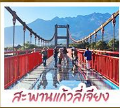
สะพานแก้วลี้เจียง