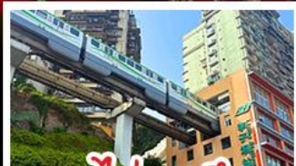
รถไฟทะลุคด