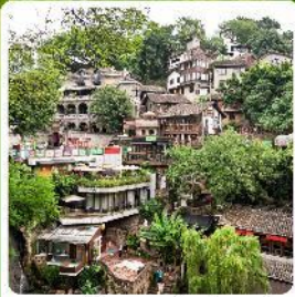
ตรอกโบราณเซี่ยฮ่าวหลี่