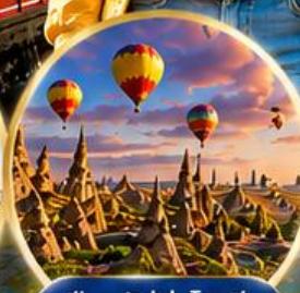
เมืองคัปปาโดเกีย Cappadocia