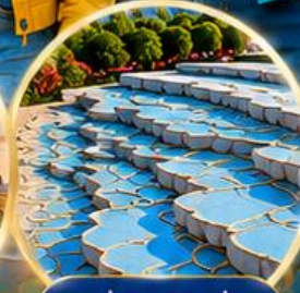
ปานุกคาล่ Pamukkale