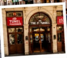
สถานีทูเนล (TUNEL STATION) สถานีรถไฟใต้ดินสายเก่าแก่ และเป็นหนึ่งในระบบขนส่งที่เก่าแก่ที่สุดในโลก