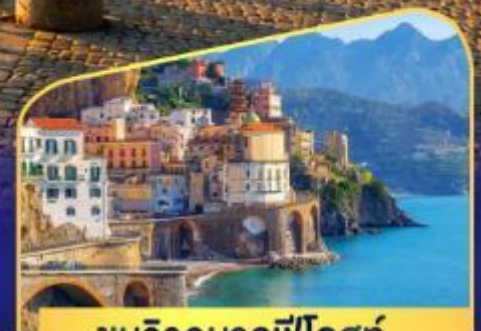
ชมวิวมอลฟีโคสก์