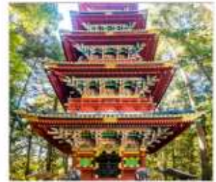
ศาลเจ้าโทโฮกุ