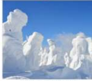
SNOW MONSTER ปีศาจหิมะ