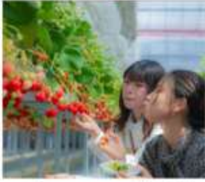
เก็บสตอเบอร์รี่นิกโก้