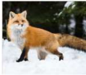
หมู่บ้านสุนัขจิ้งจอก