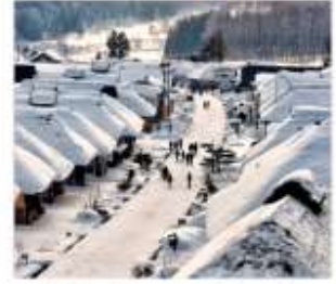
หมู่บ้านโบราณโอะอุจิจุด