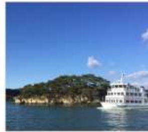
ล่องเรืออ่าวมัตสึชิม่า