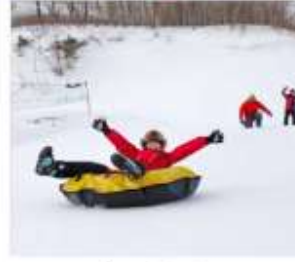
เล่นสโนว์ทูบ