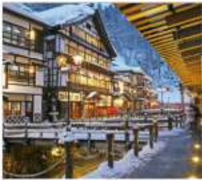
กินชังออนเซน