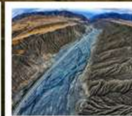
แกรนด์แคนยอนตู้ซานจื่อ