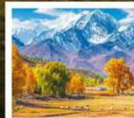
ทุ่งหญ้านาราที

ทัวร์คุณธรรม ไม่ลงร้านช้อปปิ้ง ไม่ขายออฟชั่น