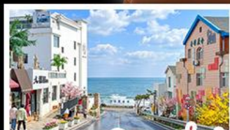
ถนนคอปเปลิ่งสาขาที่เปิด