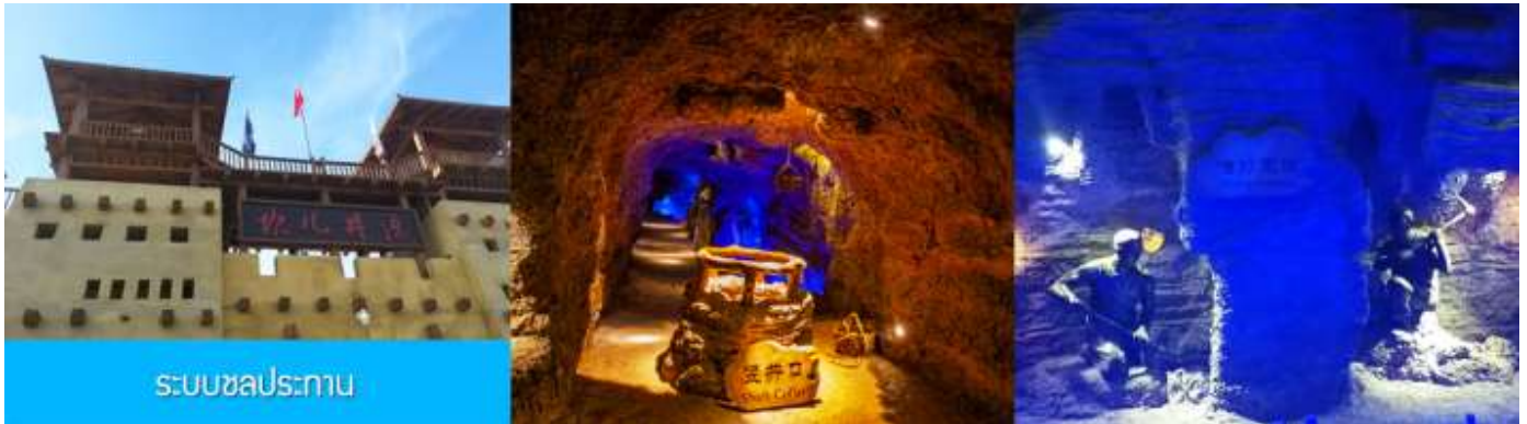
ระบบชลประทาน