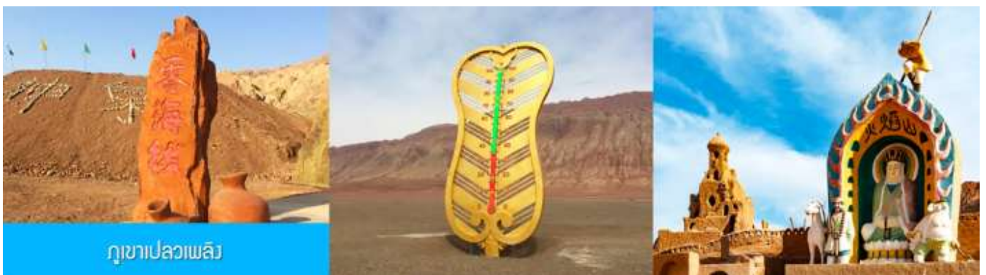
ภูเขาเปลวเพลิง

เช้า รับประทานอาหารเช้า ณ ห้องอาหารของโรงแรม (4)