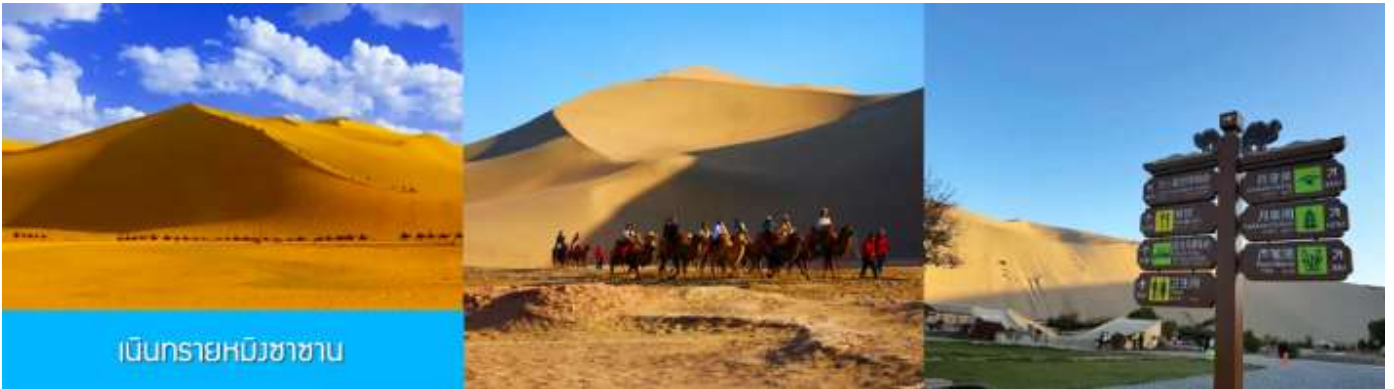
เป็นทรายหมีงาซาซาน

08.20 น. นำท่านเดินทางโดยรถไฟความเร็วสูงขบวนที่ D2708 ตู้เมืองตู้หู้ฟาน (08.20/12.34) 12.34 น. ขบวนรถไฟนำท่านเดินทางถึงสถานีรถไฟหลิวหยวน นำท่านเดินทางสู่ตัวเมืองฉุนหวง เที่ยง รับประทานอาหารกลางวัน ณ ภัตตาคาร (11)