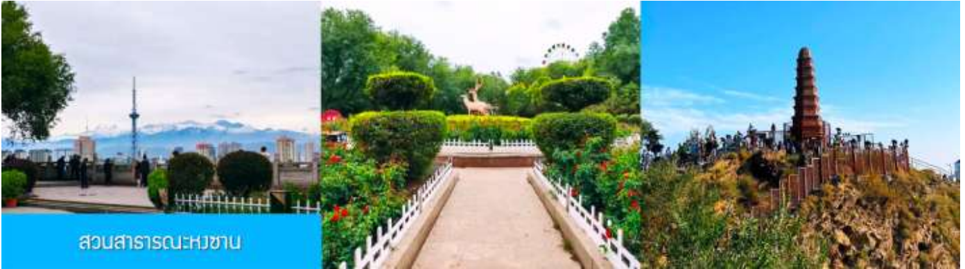
สวนสาธารณะหงซาน

โบราณนี้สร้างขึ้นในช่วงศตวรรษที่สองก่อนคริสตกาลโดยการขุดเจาะลงไปใต้พื้นดิน ภายในมีสิ่งปลูกสร้างโบราณที่มีคุณค่าทางประวัติศาสตร์ อาทิ กำแพง ป้อมปราการ ศาลาวัด และป่าเจดีย์ ฯลฯ จากนั้นนำท่านเดินทางโดยรถบัสสู่เมือง เมืองอูรูมูฉี 乌鲁木齐 (ระยะทาง 180 กม. ใช้เวลาเดินทางราว 2 ชั่วโมงครึ่ง)