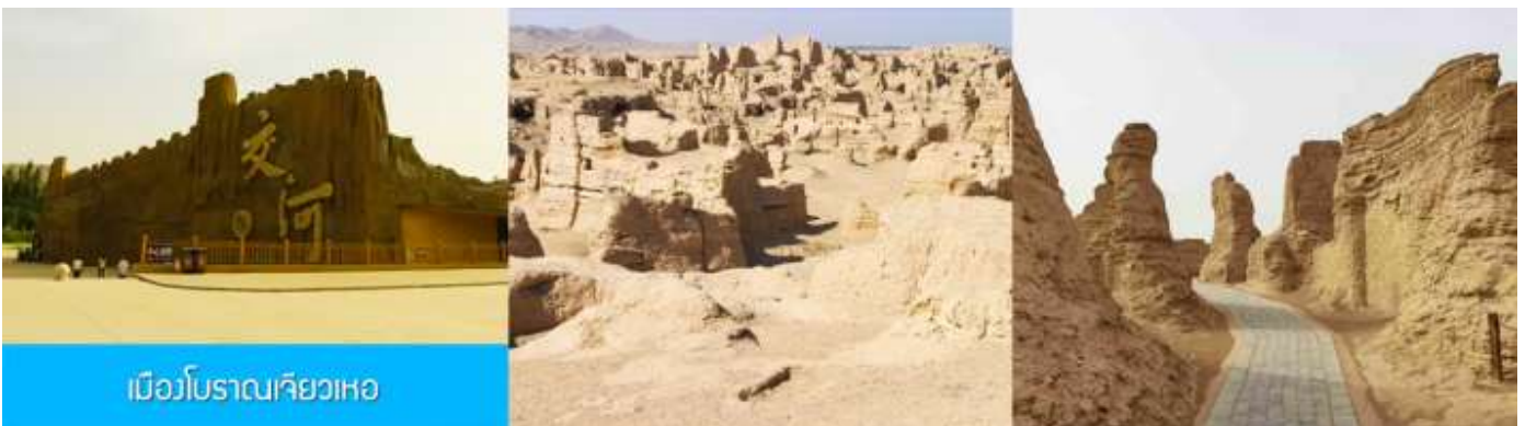
เมืองโบราณเจียวเหอ

หลังอาหารนำท่านเที่ยวชม เมืองโบราณเจียวเหอ 交河故城 (รวมรถกอล์ฟเข้าสู่อุทยาน) เมืองโบราณที่มีสิ่งปลูกสร้างดินที่สร้างอยู่ใต้ดินที่ใหญ่และยังคงสภาพสมบูรณ์ที่สุดของโลก มีอายุกว่า 2000 ปี ตั้งอยู่บนเกาะที่มีแม่น้ำสองสายมาบรรจบกัน อันเป็นที่มาของชื่อเมือง (คำว่าเจียวเหอแปลว่าแม่น้ำสองสายมาบรรจบกัน) เมือง