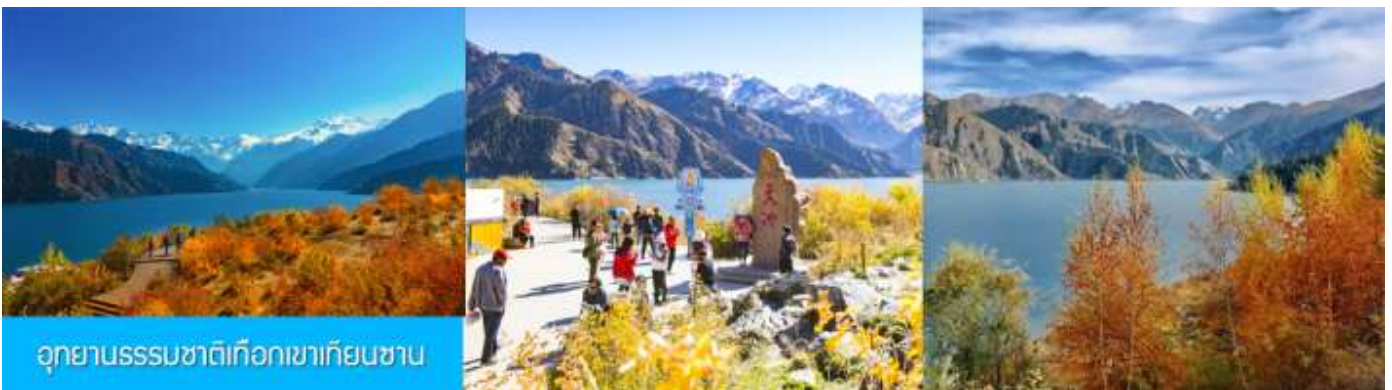
อุทยานธรรมชาติเทือกเขาเทียนชาน

เช้า รับประทานอาหารเช้า ณ ห้องอาหารของโรงแรม (7)