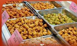
ตลาดมัจจอน