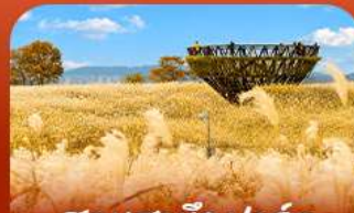
สวนฮานิลปาร์ก