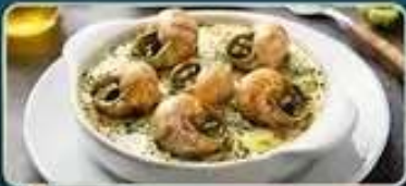
ลิ้มลองเมนูหอยเอสคาโก้