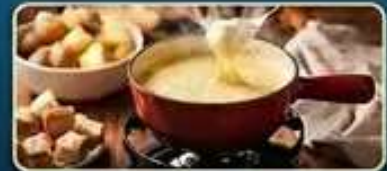
ลิ้มลองเมนูฟองดูร์ สไตล์สวิส