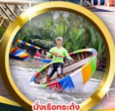
ล่องเรือกระดิ่ง